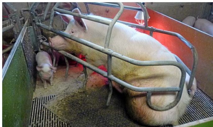
Abb. 1: Muttersau im Abferkelbereich.

Die Kastenstände im Abferkelbereich ( Abb. 1 ) unterbinden eine Bewegungsfreiheit des Muttertieres, Liege- und Kotplatz sind nicht getrennt und zahlreiche Verhaltensweisen können nicht ausgeführt werden. Die Sau-Ferkel-Interaktionen sind erheblich eingeschränkt. Die Ausrichtung der Stände entspricht nicht dem natürlichen Schutzbedürfnis der Sauen.