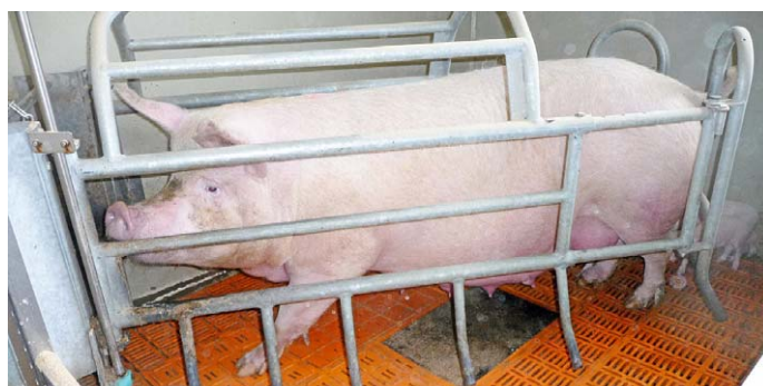
Abb. 2: Verschiedene Bodenstrukturen im Abferkelbereich.

Die Trittsicherheit ist bei Kunststoffböden nicht oder nur unvollständig gegeben, auch wenn diese mit Anti-Rutsch- bzw. Gleitschutzstegen versehen sind ( Abb. 2 ).