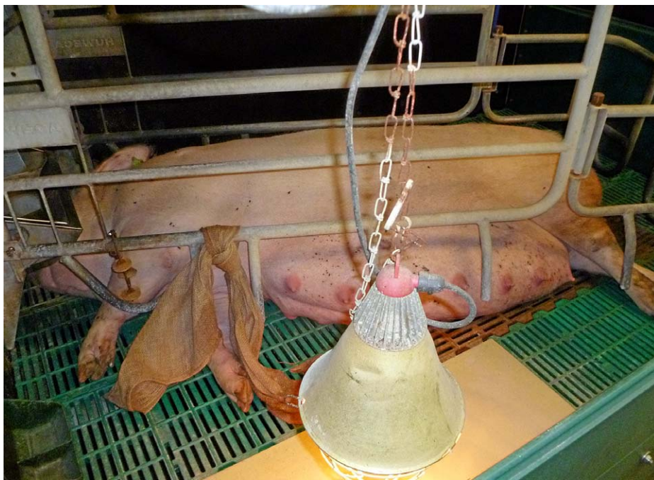
Abb. 5: Material zum Nestbau (fixierter Jutesack) und zur Beschäftigung (Mitnehmerscheiben).

nach dem Stand der Technik mit der vorhandenen Anlage zur Kot- und Harnentsorgung vereinbar ist.“