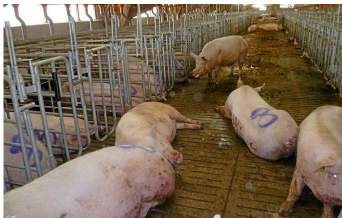
Abb. 10 und 11: Gruppenhaltung mit beidseitig angeordneten Selbstfang-Fressliegebuchten.