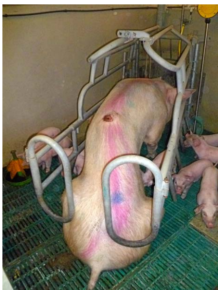
Abb. 6: Haltungsbedingte Verletzung.

§ 4 (1) Nr. 3 TierSchNutzV: „... sicherzustellen, dass soweit erforderlich unverzüglich Maßnahmen für die Behandlung, Absonderung in geeignete Haltungseinrichtungen (...) sowie ein Tierarzt hinzugezogen wird“