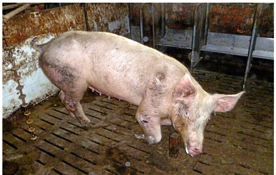
Abb. 7: Abgesonderte Sau ohne erforderliche Behandlung in einer „Krankbuch“ mit Mitnehmerscheiben als Beschäftigungsmaterial.

– evtl. zusätzliche hormonelle Ovulationssynchronisation per Injektion