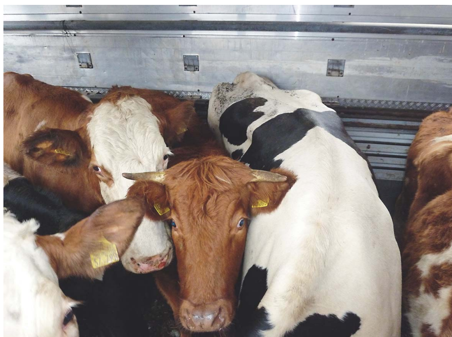
Abb. 4: Kritik an Langstrecken-Tiertransporten kommt nun auch von den europäischen Tierärzten.