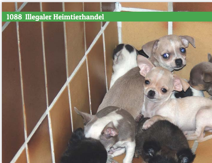
1088 Illegaler Heimtierhandel