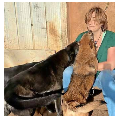
Abb. 1: Die Beurteilung des Gesundheitszustands der Tiere wurde von der offiziellen Tierärztin der Stadt Los Álamos unterstützt, eine Art Amtstierärztin, jedoch ohne die entsprechende Ausbildung, die es in Chile nicht gibt. Die aus Deutschland mitgebrachten Leberwursttuben erwiesen sich beim Überprüfen der Mikrochips als hilfreich. Für die klinischen Untersuchungen und die Verhaltensbeobachtungen waren zunächst einige Tage Vertrauensarbeit nötig, sprich Hinsetzen und Kommenlassen.