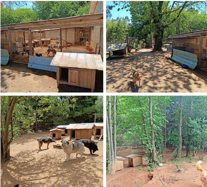
Abb. 2: Das Gelände von Ayin Ruka hat rund 2 ha, davon ist 1 ha umzäunt und in insgesamt 14 Parzellen von unterschiedlicher Größe und Struktur unterteilt. Dort werden die Hunde in verträglichen Gruppen gehalten. Die Zäune sind in einem miserablen Zustand, sodass sich die Tiere immer mal wieder drunter durch oder drüber weg arbeiten. Das unbenutzte Gelände könnte man gut zum Spazierengehen, Leinentraining etc. nutzen, aber so etwas ist in Chile kaum bekannt, und die Betreuerin Otilia Munizaga hätte weder Zeit, Kraft noch Kenntnisse dafür.