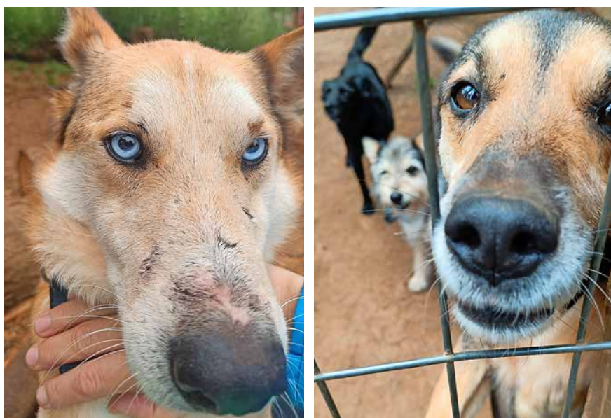
Abb. 4: Die meisten Hunde sind zutraulich, manche zunächst vorsichtig, einzelne auch sehr ängstlich. Nach wenigen Tagen des Kontaktes bricht das Eis aber. Alle Tiere werden sofort kastriert, auch die trächtigen Hündinnen.

Aussicht stellt. Sollte also ein entsprechender Antrag im September 2024 erfolgreich sein, wird Ayin Ruka 3.0 starten können, die dritte Phase des Projekts, in der es um die Einarbeitung einer neuen Tierheimleitung und um umfassende Reparatur- und Renovierungsarbeiten auf dem Gelände geht.