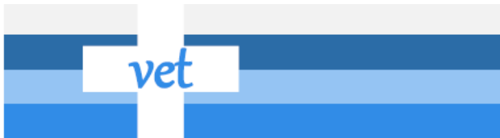
Abbildung 1: Änderungsvorschlag für das neue Versandhandelslogo